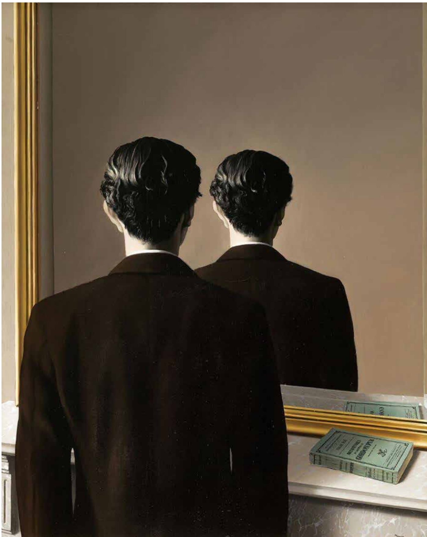
La Reproduction Interdite - René Magritte, Brussel, 1937